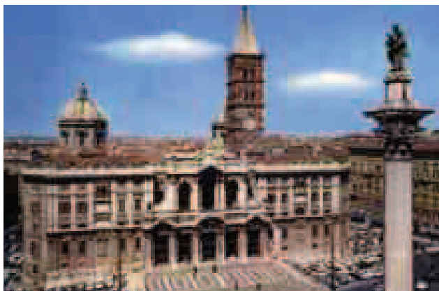
Fondata nell'anno Santo 1925

Maschere In alcuni locali è stato vietato di portare collane di aglio